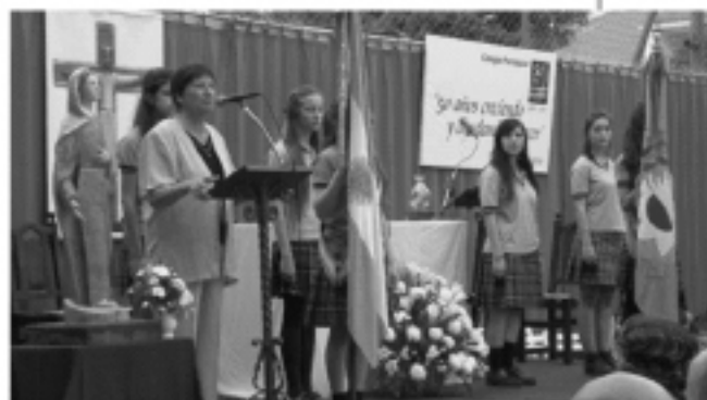
Las palabras de nuestra Vice Directora de EP