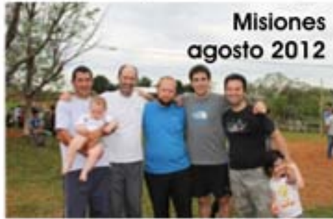
Misiones agosto 2012